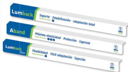
Regletas lineales 60x5 cm.