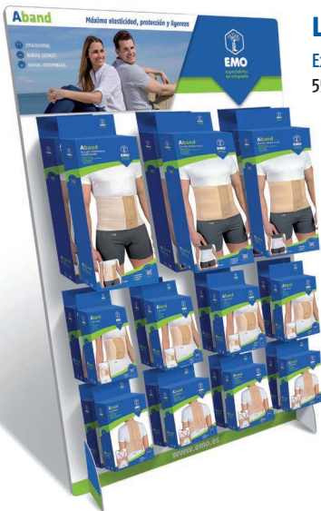
Lumback y Aband Expositores sobremesa 55x86 cm.