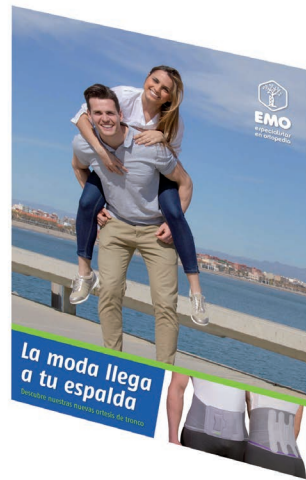
Display vertical 45x70 cm.