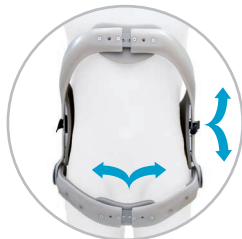
Ancho y alto personalizable