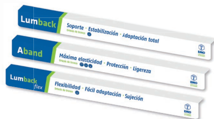
Regletas lineales 60x5 cm.