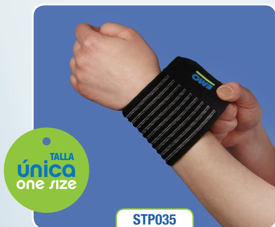
STP035 Strap in de muñeca [165210]